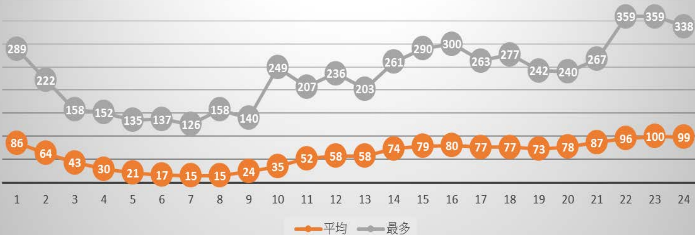
尖峰離峰使用人次統計(尖峰月份總表)